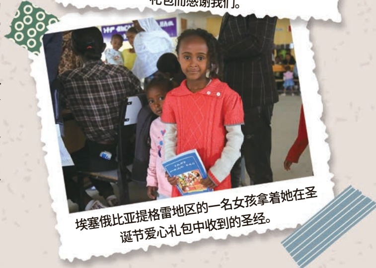
埃塞俄比亚提格雷地区的一名女孩拿着她在圣诞节爱心礼包中收到的圣经。