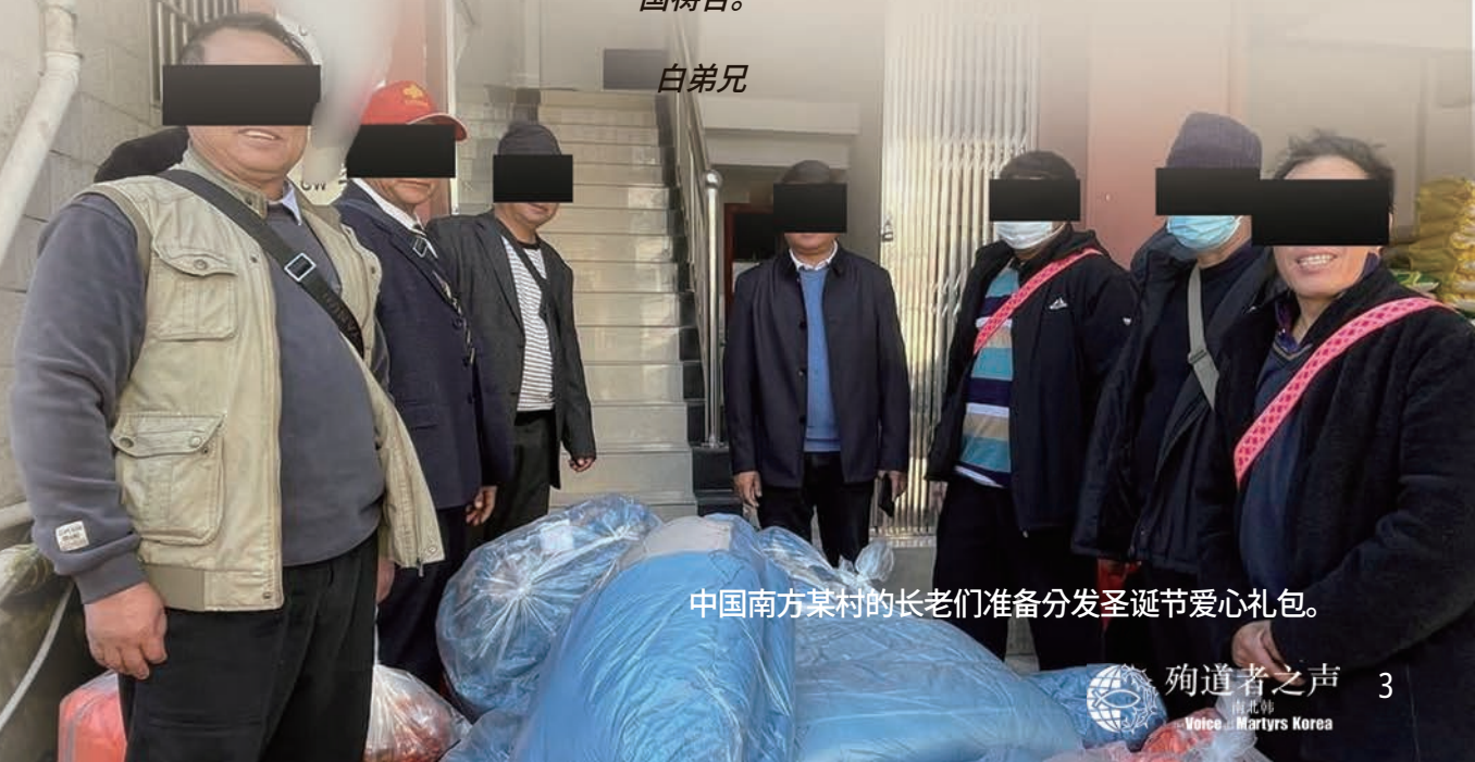
中国南方某村的长老们准备分发圣诞节爱心礼包。