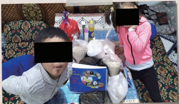
两名乌兹别克斯坦儿童与圣诞节爱心礼包里的礼物拍照。

我是乌兹别克斯坦教会的一位牧师，我要感谢你们以食物和新年礼物的形式提供的兄弟般的帮助。我们收到了 55 份爱心礼包。我们将其分发到三个城市和地区的有需要的兄弟姐妹。这是新年和圣诞节前的美好祝福。收到这些礼物和祝福的家庭非常高兴并感谢上帝。我谨代表这些家庭并以我个人的名义，感谢所有参与这项事工的人。正如经上所记，“有施散的，却更增添”。愿父神祝福您并奖赏您那兄弟般的爱！