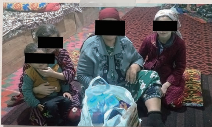
一家人坐在去年圣诞节收到的圣诞节爱心礼包后面。