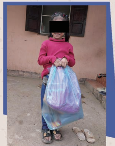
一名老挝女孩自豪地拿着她收到的圣诞节爱心礼包。