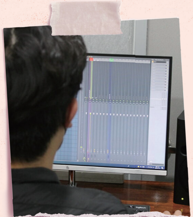
殉道者之声 (南北韩) 工作人员在录制中文短波广播节目。 ▲

在中国, 虚拟私人网路 (VPN) 的使用是能被追踪的。在网站上发表评论的基督徒会被追踪。甚至通过商店和网站购买基督教书籍的基督徒也会被追踪和处罚。基督教短波广播现在是中国基督徒每天可以安全和匿名访问基督教内容的唯一媒体。中国每年销售数千万台短波收音机, 而中国政府本身也广泛使用短波广播, 他们根本不可能知道谁在用短波收音机收听基督教广播。而且由于基督教短波无线电广播主要是布道和其他口头音频内容, 因此短波的质量有足够保障。这种二战时期的技术非常适合在二十一世纪用来将福音传遍整个中国。