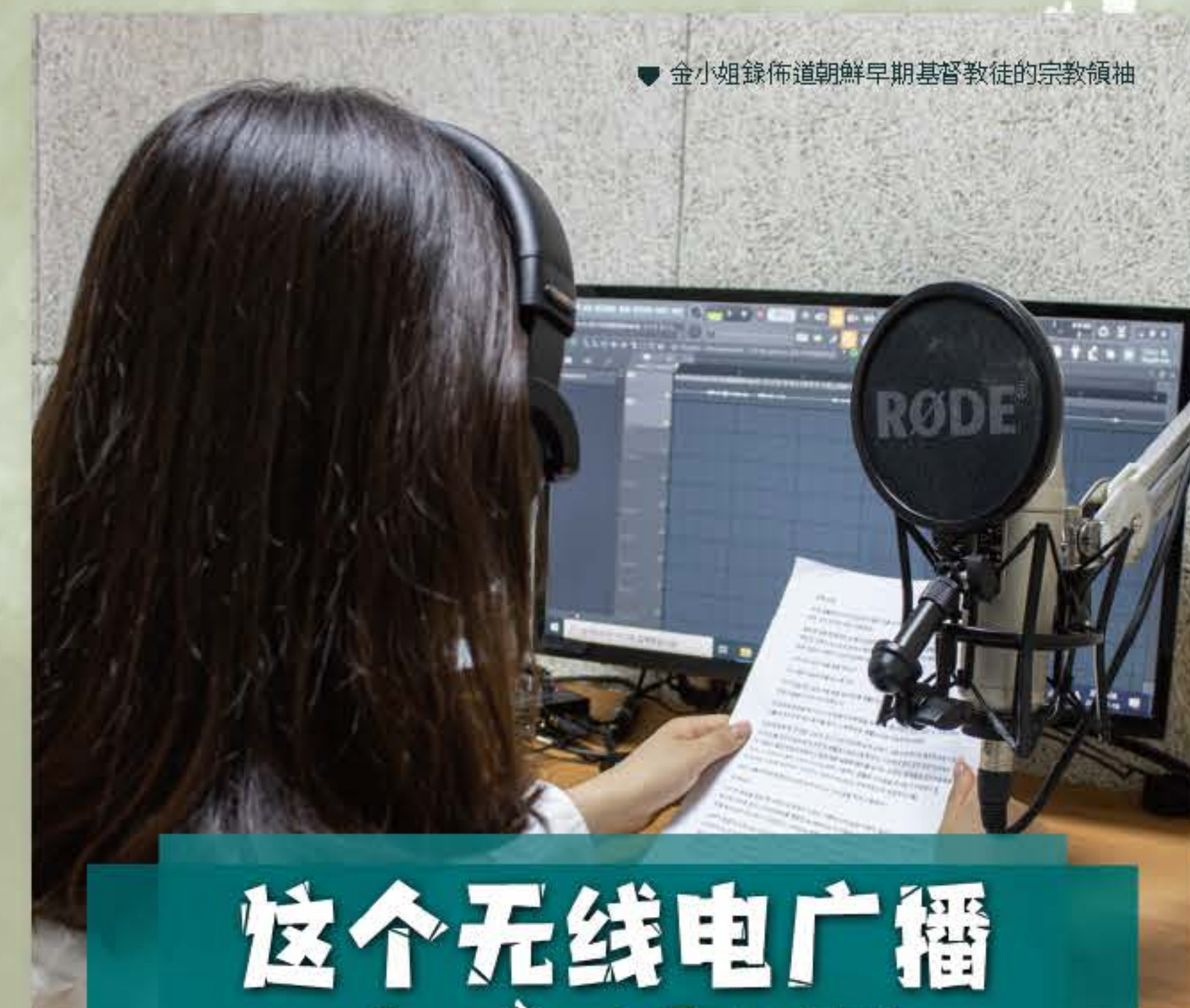
金小姐錄佈道朝鮮早期基督徒的宗教領袖