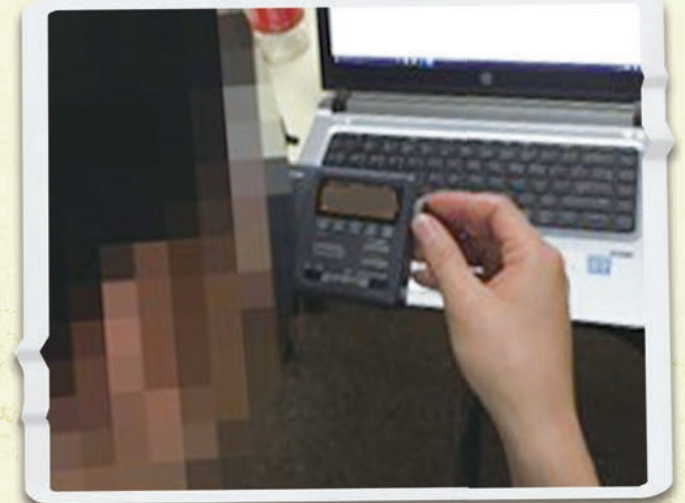
Наш волонтер настраивается на трансляцию в Северную Корею из Северо-Восточного Китая

Частоты средних волн невозможно изменить или отрегулировать так же легко, как частоты коротких волн. По сравнению с блокировкой одного, фиксированного, более дорогого средневолнового вещания, направляемого на узкую область, для блокировки коротковолнового вещания, необходимо распределять помехи по разным частям каждой трансляции в разные периоды времени и на более обширной территории, охватываемой коротковолновым вещанием. Для правительства Северной Кореи выполнять эту задачу