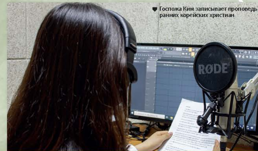
Госпожа Ким записывает проповедь ранних корейских христиан