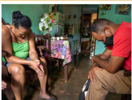
▲ 一名前线工作人员在古巴进行牧灵访问期间与基督徒一起祷告

古巴官员最近锁定了一位著名牧师，因为他致力于教授圣经原则，反对政府政策。这位牧师的大胆言论以及他的教堂靠近政府办公室，导致古巴当局突袭这位牧师的家，希望迫使他屈服。