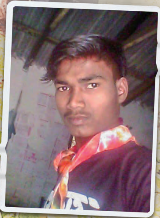
▲ Тело Самару было найдено побитым камнями, расчлененным и частично закопанным