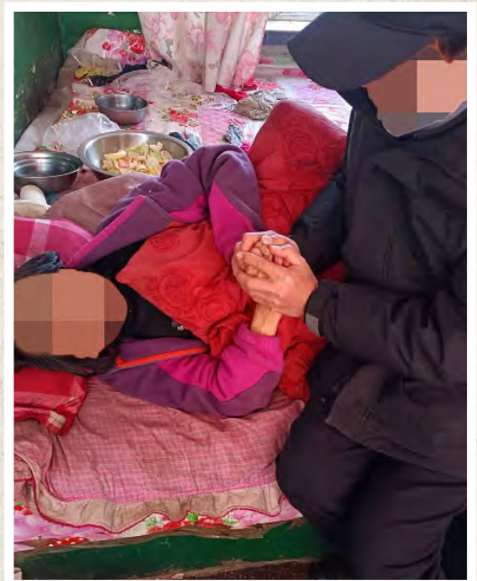
▲ Партнер Голос мучеников - Корея молится с миссис Б перед смертью.

Поскольку положение северокорейцев настолько тяжелое из-за пандемии и ужесточения ограничений в Китае, они обнаруживают, что Христос и Слово Божье — их единственная надежда. Рассказывая нам об этой истории, наш партнер сказал: «С подобными историями я сталкиваюсь ежедневно». Из-за повышенных ограничений на поездки иногда наш партнер может встретиться с беженцами из Северной Кореи только один раз, поэтому на каждой встрече он обязательно раздает MP3-плееры. И Господь продолжает говорить северокорейцам Свое слово.