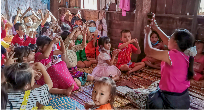
▲ Видя острую необходимость в обучении следующего поколения учеников Иисуса, христиане Лаоса рискуют многим, чтобы обучать детей Слову Божьему.