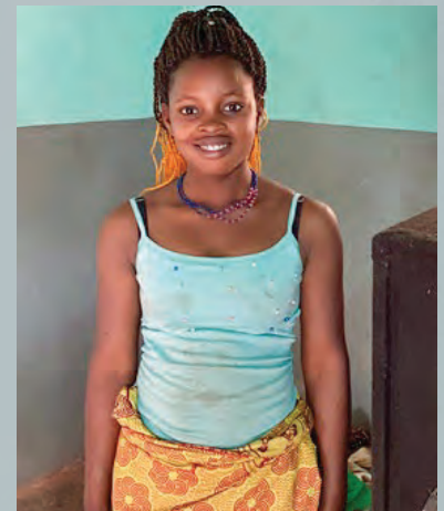
Дивайн, 22 года, выгнали из дома, когда она отказалась отречься от своей веры во Христа.

Недавно жители одной деревни напали на христиан, которые молились дома во время проведения традиционных обрядов в деревне. Было разрушено шесть домов, один человек убит, многие ранены. «С точки зрения духовности, это темный регион», - сказал партнер Голоса мучеников.