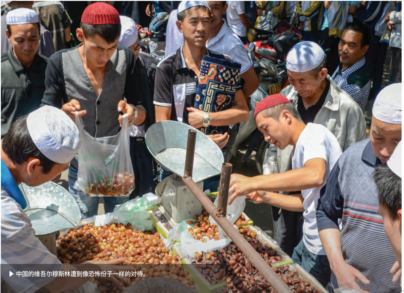
► 中国的维吾尔穆斯林遭到像恐怖份子一样的对待。