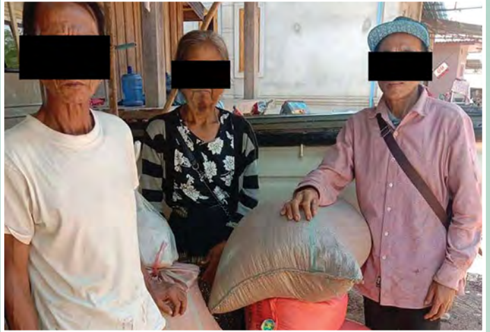
▲ 即便这些越南基督徒在饥荒期间因为被指控信奉“外国”宗教而得不到任何粮食援助，他们仍然刚强壮胆地留在了本地

尽管逼迫仍在继续，但这些家庭的信心仍然坚定，并继续聚会敬拜。“我们情况很好，”他们在感谢信中说。“我们每天都在寻求主，……我们感谢你们今年对我们的援助，虽然除了我们的爱和祈祷，我们没有什么可以回报你们的。”