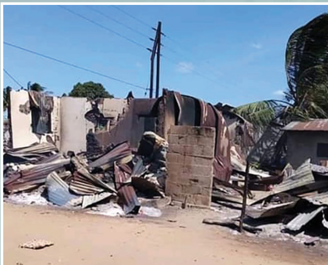
▲ 在莫桑比克，成千上万的人因为伊斯兰叛乱份子逃离了家乡，而其中的基督徒尤其会遭到针对性的攻击

伊斯兰叛乱份子已经严重威胁了许多当地人的生命安全，基督徒的处境尤为严峻。当地的侍工报告称，伊斯兰主义者烧毁当地的教堂、斩首基督徒，他们还摧毁学校、诊所以及警察局。VOM已经援助了这些流离失所的基督徒应急食物，并给这些基督徒配给了他们母语的语音圣经。