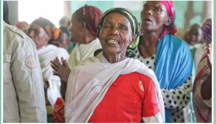
▲ 埃塞俄比亚活跃而增长快速的福音派基督徒人口使他们成为了被迫害的目标

在袭击发生几个月之前，当地的一名东正教祭祀要求福音派的基督徒一同参与一个以一名死人名命名的宴会，虽然他早知道福音派基督徒通常不参加这种典礼。当祭祀遭到拒绝之后，祭祀对他们施以了报复。后来福音派基督徒将这件事反应给了政府官员，这使得东正教祭祀也因为其违法行为受到了罚款。作为报复，祭祀鼓动他的信徒烧掉福音派基督徒的房屋和商铺。