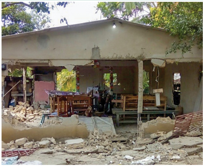
▲ 当局摧毁了古巴圣地亚哥的一座浸信会教堂

当全世界许多教会因为新冠疫情爆发而使用网络聚会时，古巴的基督徒却无法使用这种方式聚会，因为只有很少的人可以使用网络，信众一旦停止聚会就会彻底丧失敬拜和团契的机会。此外，当地基督徒还担心政府未来会发布更多禁令，那样将极大地影响他们的门训以及敬拜聚会。