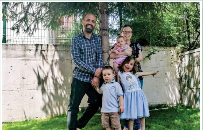
▲ 乔伊对判决提出了上诉，但是前景并不乐观

2020年6月，雷杰普·埃尔多安（Recep Erdogan）总统宣布，建于6世纪的圣索菲亚大教堂从博物馆被改建成清真寺，该建筑物从1453年开始到1935年始终作为博物馆使用。土耳其一名从事出版物的侍工领袖说：“这个新的现象说明还会有更加大的动作在后面。”