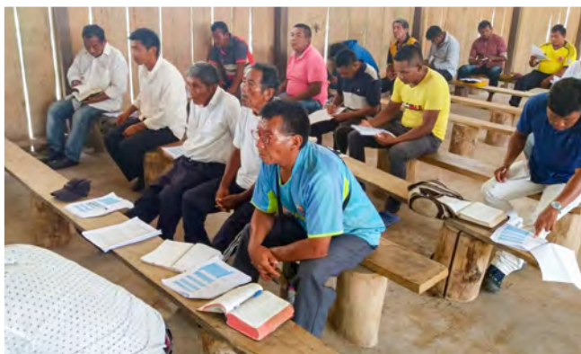
▲ Голос мучеников собирает пасторов, несущих служение в трудных районах, для обучения, обновления и общения.

Поскольку в апреле прошлого года по всей Колумбии был введен режим самоизоляции из-за коронавируса, повстанческие группы в «красных зонах» страны совершали нападения на христиан, вернувшись к жестокости, которой они были известны в прежние годы.