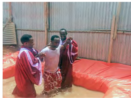
▲ Эфиопские христиане крестили бывших сомалийских мусульман на заднем дворе церкви, которая когда-то была публичным домом.

Другой служитель в Африке также отметил обнадеживающие результаты текущей работы в Сьерра-Леоне. Несколько лет назад Голос мучеников помог создать программу профессиональной подготовки, в рамках которой проводились курсы шитья, а также наставничество и общение для молодых верующих женщин. «Когда я впервые познакомился с ними, они практически не улыбались», - сказал служитель. «Они были очень серьезными».