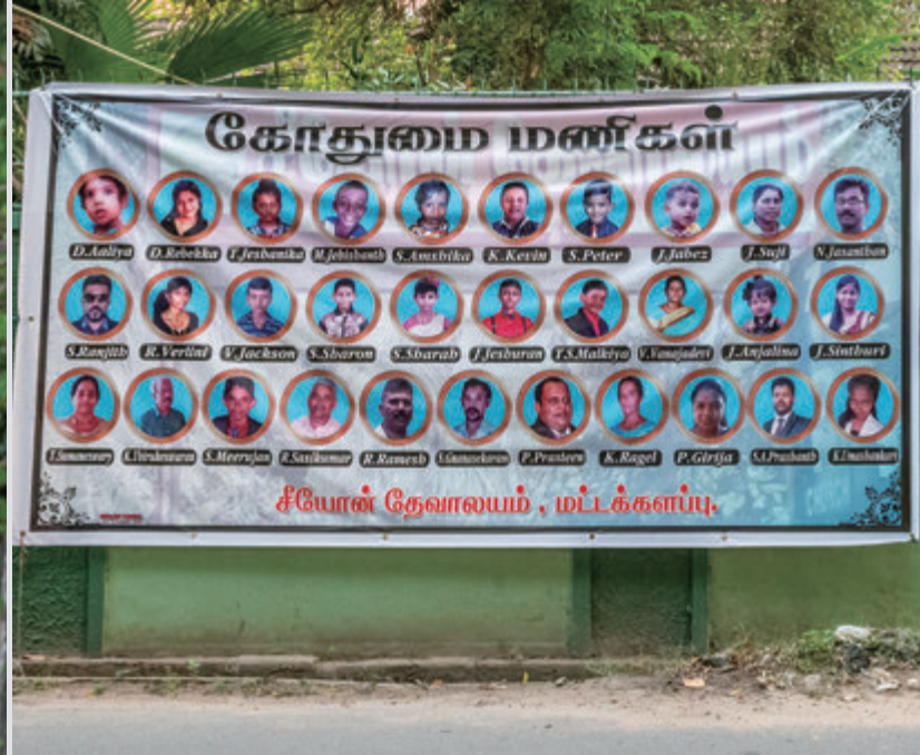
▲ Баннер с фотографиями и именами жертв взрыва бомбы