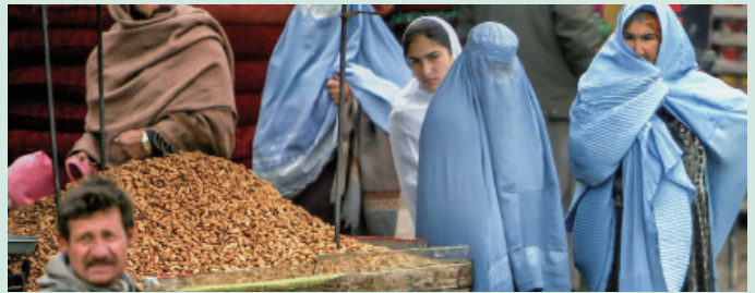
Женщины в афганском обществе часто ограничиваются домом. Небольшие домашние собрания - это эффективный способ делиться с ними Евангелием. Молитесь, чтобы верующие и дальше находили необычные способы благовествовать благодаря которым многие могли познать Иисуса.