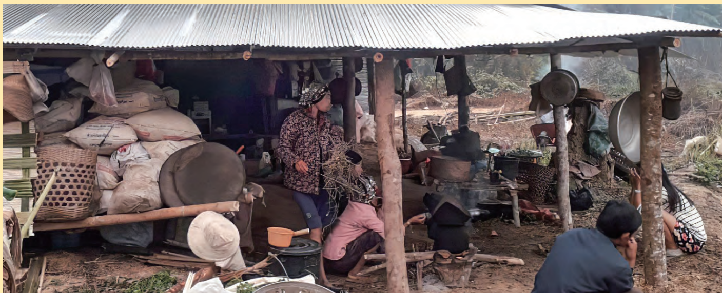
▲ Голос мучеников оказал помощь трем христианским семьям по переезду на новое место. Эти семьи после изгнания из родной деревни провели несколько недель практически на обочине дороги.