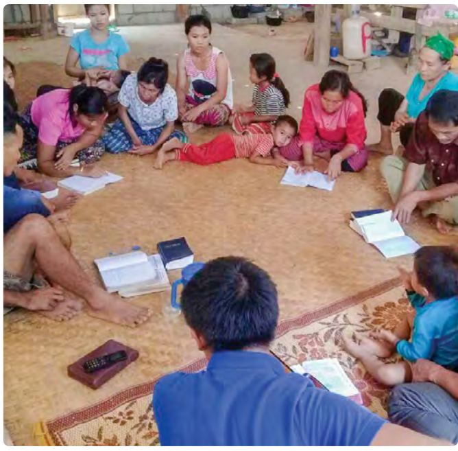
▲ Фото: Хвала Богу за новообращенных из племенной группы Прай. Просите Бога, чтобы они укреплялись Его Словом.

Племя Прай является представителями группы меньшинств, проживающих в Лаосе и Таиланде, зачастую выходцы из этого племени находятся за чертой бедности и часто нанимаются на черную работу. "Полевые" служители говорят, что в районе проживает от 800 до 900 христиан и 11 церквей и что там верующие испытывают серьезные гонения. Два служителя, которые встретились с лидерами церкви племени Прай, недавно заявили, что большинство христиан готовы твердо стоять в своей вере.